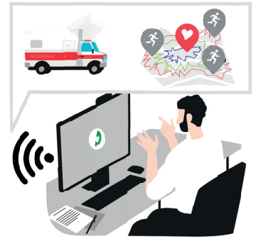
| 2 | Dynamische isochronenbasierte Alarmierung