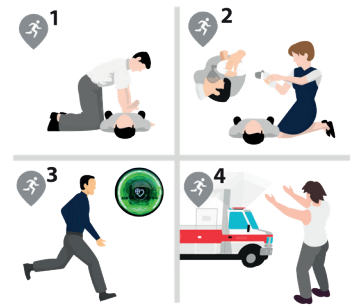
| 4 | Rollenzeilung für die Ersthelfer*innen