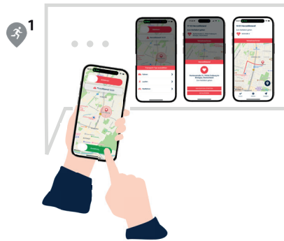
| 3 | Einsatzübernahme durch die Lebensretter*innen